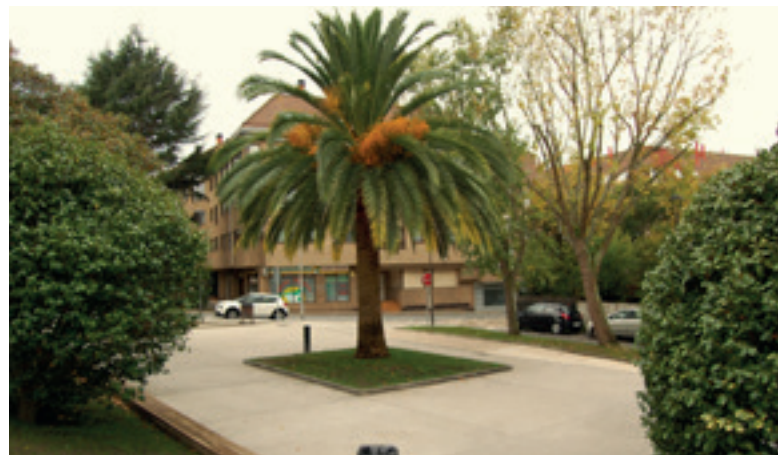
Praza Charles Darwin