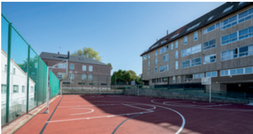
Polideportiva Cova dos Bois

Con anterioridade abordáronse as obras da rúa Xuncal e rúa Darwin, cunha renovación completa da praza e unha importante actuación de mellora da pista polideportiva.