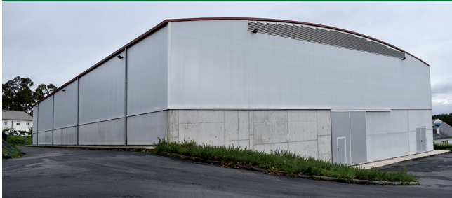
O concelleiro de urbanismo declara na Fiscalía