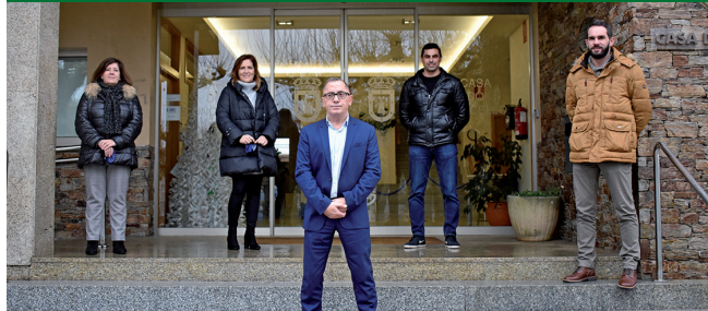
O Goberno avanza na humanización das rúas