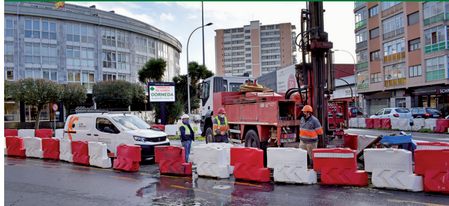
Comeza a obra do cruce de Sol y Mar