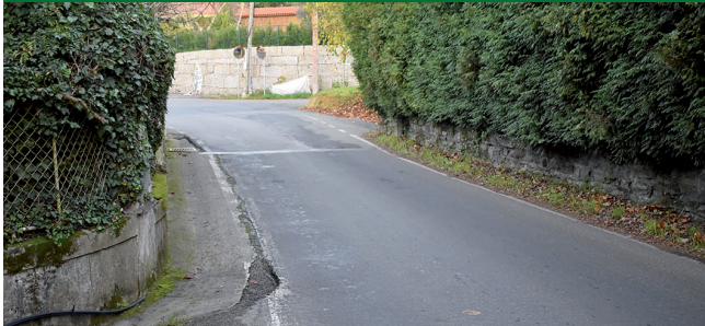
Adxudicado o proxecto para eliminar o tapón en San Paio