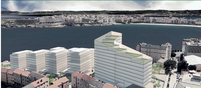
Nova ameaza contra a fachada marítima en Labañou