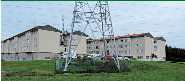
Urbanización Sol y Mar: o engano eterno do Concello