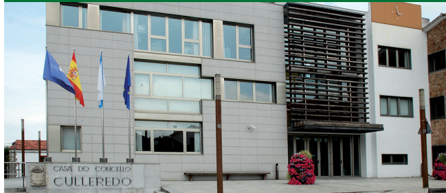
Praza de arquitecto municipal creada irregularmente