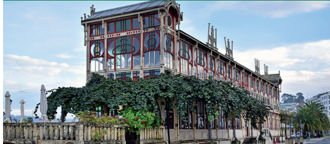
Alternativa demanda a conservación da Terraza